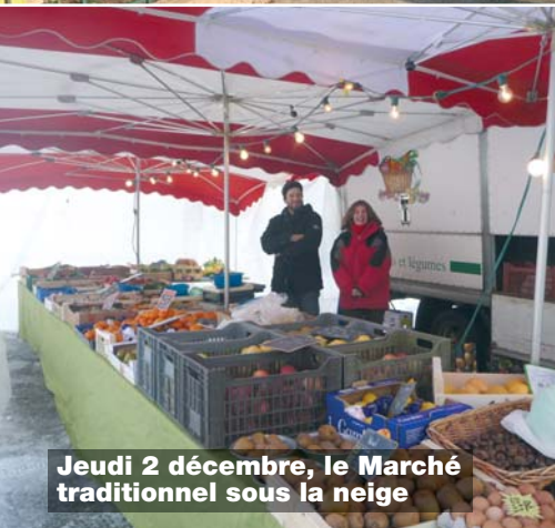
Jeudi 2 décembre, le Marché traditionnel sous la neige