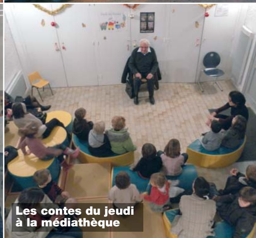
Les contes du jeudi à la médiathèque