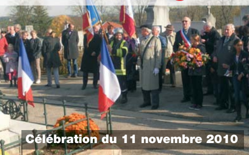
Célébration du 11 novembre 2010