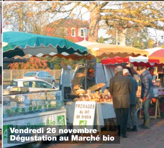
Vendredi 26 novembre Dégustation au Marché bio