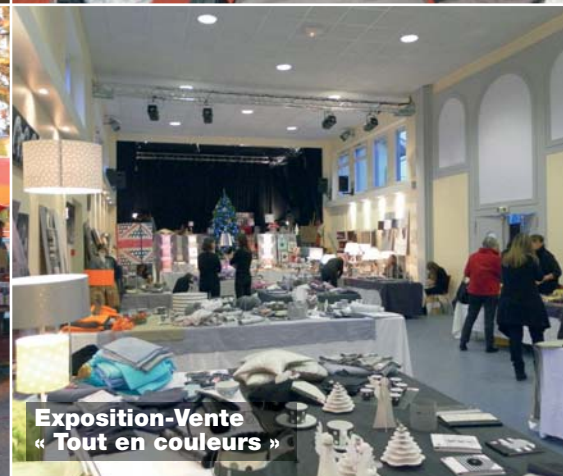
Exposition-Vente « Tout en couleurs »