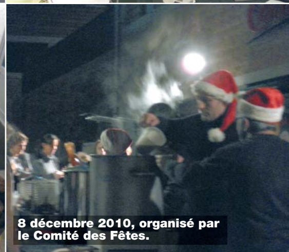
8 décembre 2010, organisé par le Comité des Fêtes.