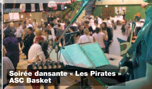
Soirée dansante « Les Pirates » ASC Basket