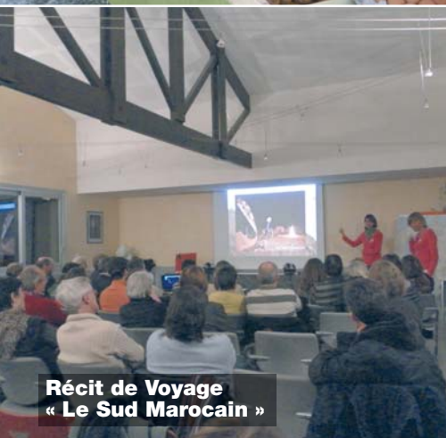
Récit de Voyage « Le Sud Marocain »