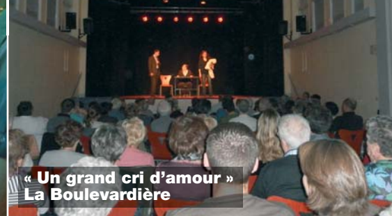
« Un grand cri d'amour » La Boulevardière