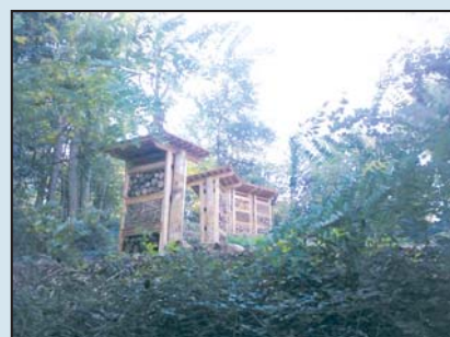
Un futur parc public de loisirs, quai de la Jonchère et les installations pédagogiques de l'Espace Nature Aquaria.