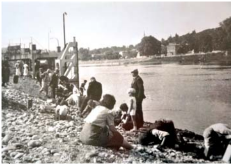
Après le sabotage, les habitants récupèrent l'essence.

La zone des Sablières est historiquement polluée depuis le 18 juin 1940. A cette date l'Etat français avait ordonné le sabotage d'un dépôt pétrolier installé sur cette zone. C'est ainsi qu'une quantité importante d'hydrocarbures a été déversée dans le sous-sol, pour éviter que ces produits sensibles puissent être utilisés par "l'ennemi" qui s'approchait de Macon.