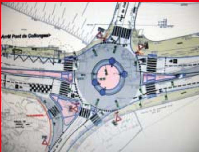
Pont de Collonges.