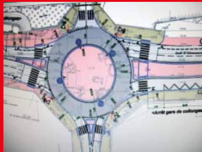
Pont de Fontaines.