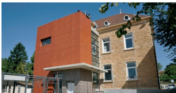
L'extension arrière de la mairie (mariage de moderne et de l'ancien)