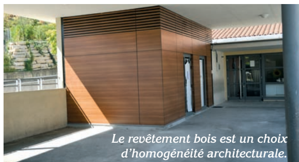
Le revêtement bois est un choix d'homogénéité architecturale.

Ce n'est qu'en 1957 que la totalité des locaux a été consacrée aux services publics. Il devenait donc nécessaire de faire dans ce bâtiment patrimonial de qualité ces travaux de réhabilitation et de modernisation, et de répondre aux sollicitations de la population de Collonges, l'augmentation de 1953 à nos jours étant évaluée à 60 %.