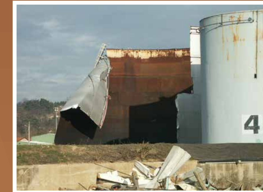
Vue de la Zone Industrielle : pendant la déconstruction du dépôt Shell