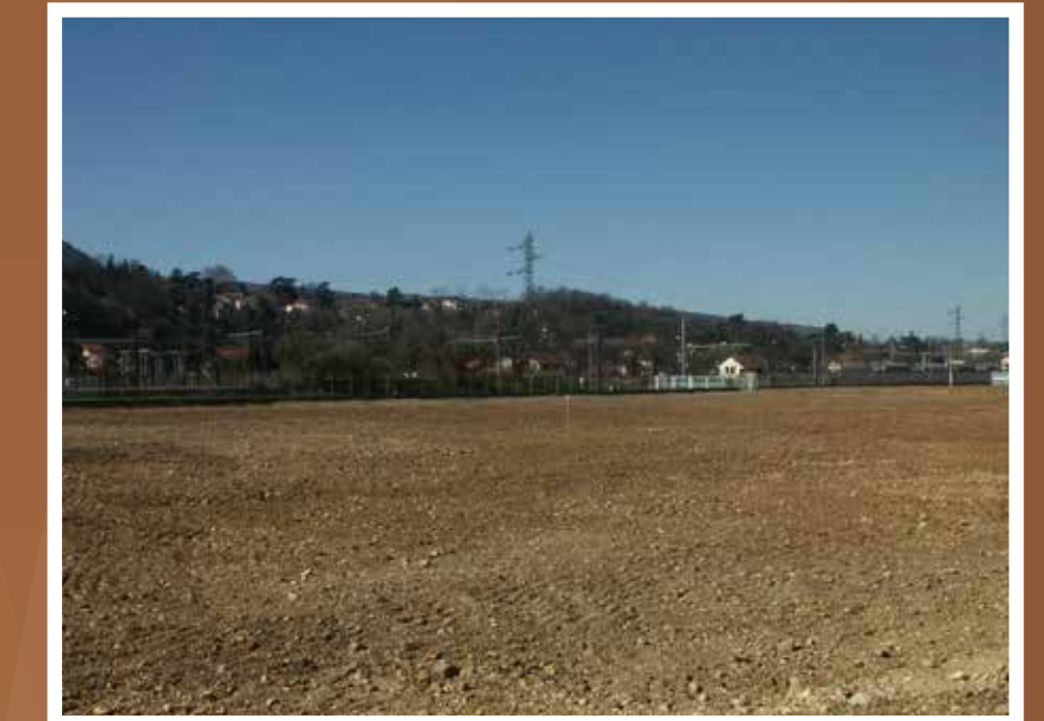
Vue actuelle de la Zone Industrielle en attente de dépollution