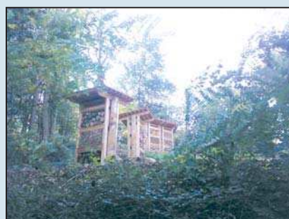
Un futur parc public de loisirs, quai de la Jonchère et les installations pédagogiques de l'Espace Nature Aquaria.