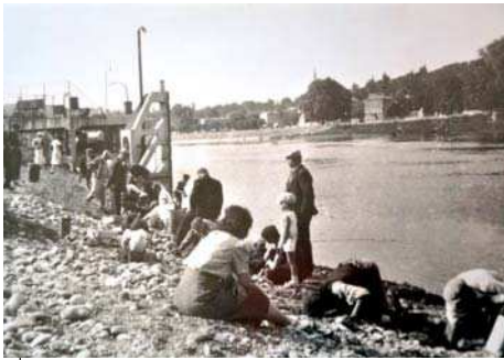
Après le sabordage, les habitants récupèrent l'essence.

La zone des Sablières est historiquement polluée depuis le 18 juin 1940. A cette date l'Etat français avait ordonné le sabordage d'un dépôt pétrolier installé sur cette zone. C'est ainsi qu'une quantité importante d'hydrocarbures a été déversée dans le sous-sol, pour éviter que ces produits sensibles puissent être utilisés par "l'ennemi" qui s'approchait de Macon.