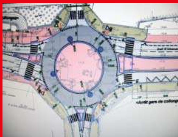
Pont de Fontaines.