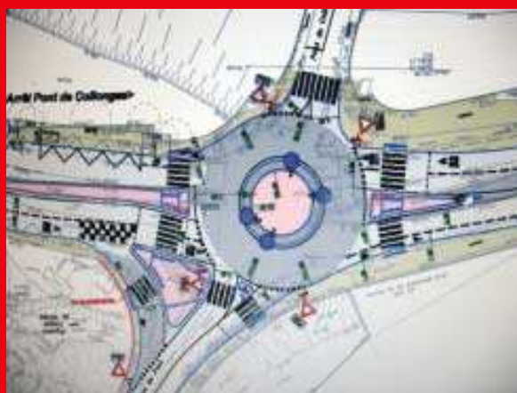
Pont de Collonges.