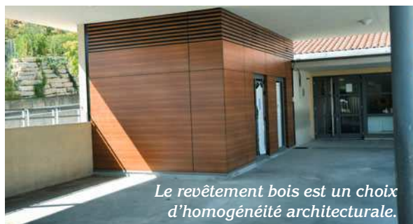
Le revêtement bois est un choix d'homogénéité architecturale.

Ce n'est qu'en 1957 que la totalité des locaux a été consacrée aux services publics. Il devenait donc nécessaire de faire dans ce bâtiment patrimonial de qualité ces travaux de réhabilitation et de modernisation, et de répondre aux sollicitations de la population de Collonges, l'augmentation de 1953 à nos jours étant évaluée à 60 %.