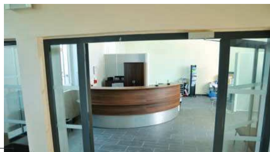
La salle d'accueil du public plus vaste et conviviale

Les travaux de rénovation de la mairie se sont achevés fin août. Ces travaux étaient nécessaires pour plusieurs raisons ; d'une part, pour offrir au public des locaux plus accueillants et aux agents communaux des conditions de travail plus ergonomiques, d'autre part, pour permettre comme l'exige la réglementation l'accès aux personnes à mobilité réduite à tous les étages et services. Il a donc été nécessaire de créer un ascen-