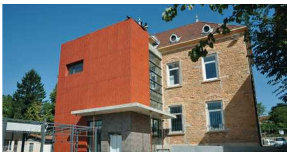
L'extension arrière de la mairie (mariage de la moderne et de l'ancien)