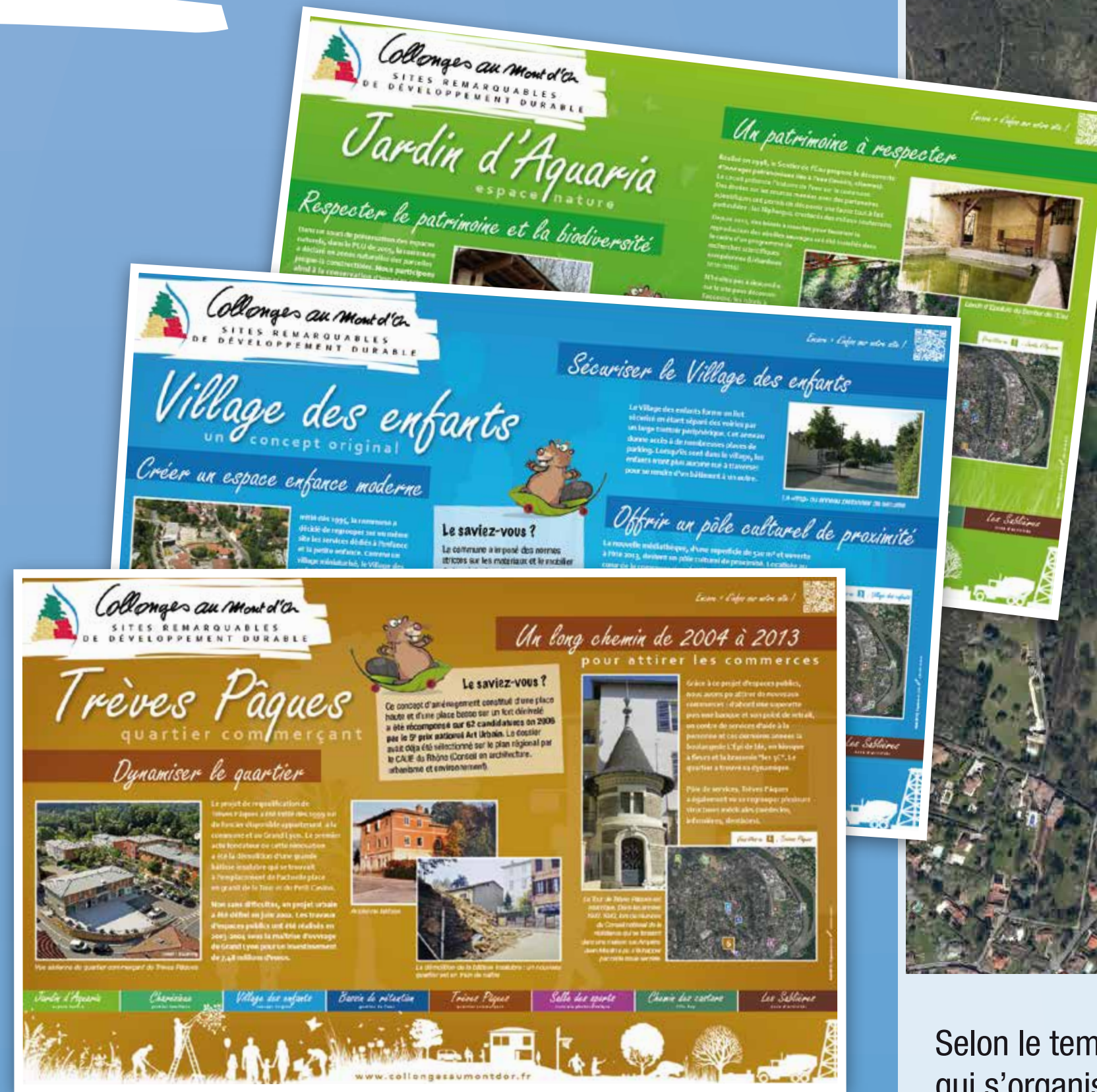
Exemples de panneaux

Un dépliant qui présente la visite des sites remarquables de Développement Durable de Collonges-au-Mont-d'Or est à votre disposition à l'accueil de la mairie.